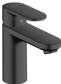
hansgrohe Vernis Blend Waschtischarmatur 100