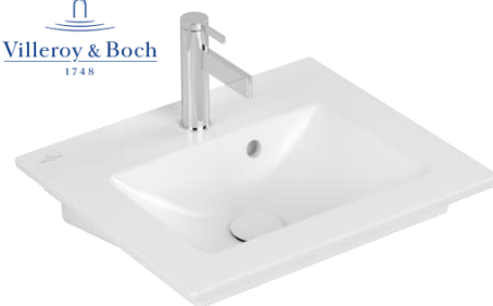
Venticello Waschtisch 50 x 42 cm