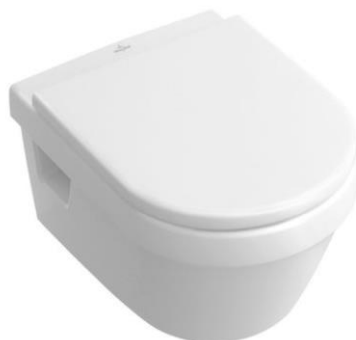
V & B Taro WC und WC Sitz Slim Seat mit Absenkautomatik