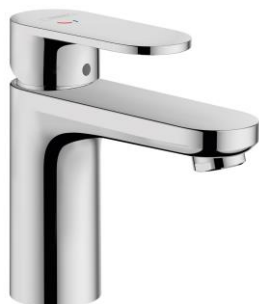
hansgrohe Vernis Blend Waschtischarmatur 100